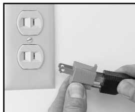
Fig. 6-2 Incorrect