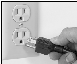
Fig. 6-1 Correcto

ESTA MÁQUINA SE PROPORCIONA CON UN ENCHUFE DE TRES CLAVIJAS CON CONEXIÓN A TIERRA. EL TOMACORRIENTE AL CUAL SE CONECTE ESTE ENCHUFE DEBE TENER UNA CONEXIÓN A TIERRA ADECUADA. SI EL RECEPTÁCULO NO TIENE EL TIPO DE CONEXIÓN A TIERRA ADECUADO, COMUNÍQUESE CON UN ELECTRICISTA. BAJO NINGUNA CIRCUNSTANCIA CORTE O quite LA TERCERA CLAVIJA DE CONEXIÓN A TIERRA DEL CABLE DE ALIMENTACIÓN NI USE UN ADAPTADOR (fig. 6-1 y fig. 6-2).