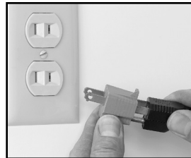
Fig. 6-2 Incorrecto