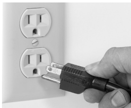
Fig. 6-1 Correct

CETTE MACHINE EST FOURNIE AVEC UNE FICHE DE MISE À LA TERRE TRIPOLAIRE. LA PRISE DANS LAQUELLE CETTE FICHE EST BRANCHÉE DOIT ÊTRE MISE À LA TERRE. SI LA PRISE NE DISPOSE PAS DU TYPE DE TERRE CORRECT, CONTACTEZ UN ÉLECTRICIEN. NE COUPEZ OU NE RETIREZ EN AUCUN CAS LA TROISIÈME BROCHE DE TERRE DU CORDON D'ALIMENTATION ET N'UTILISEZ JAMAIS DE FICHE D'ADAPTATION (Fig. 6-1 et Fig. 6-2).