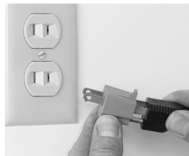
Fig. 6-2 Incorrect