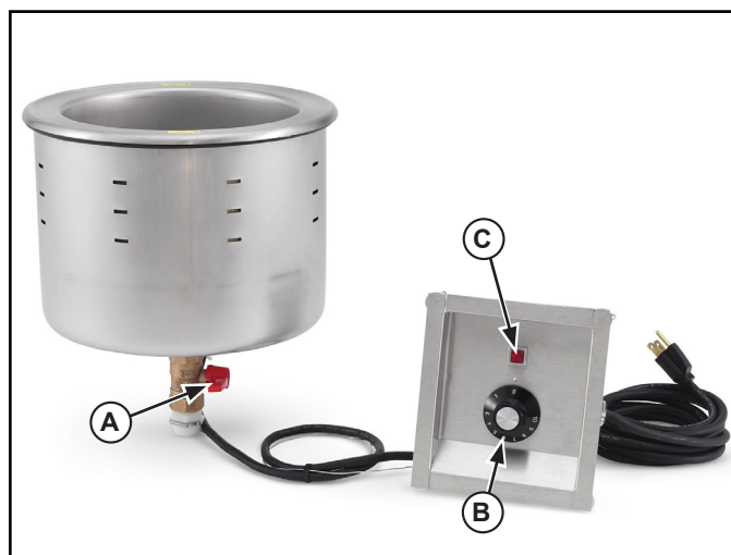
Figura 1. Características y controles.