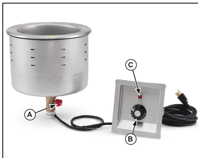
Figure 1. Caractéristiques et commandes